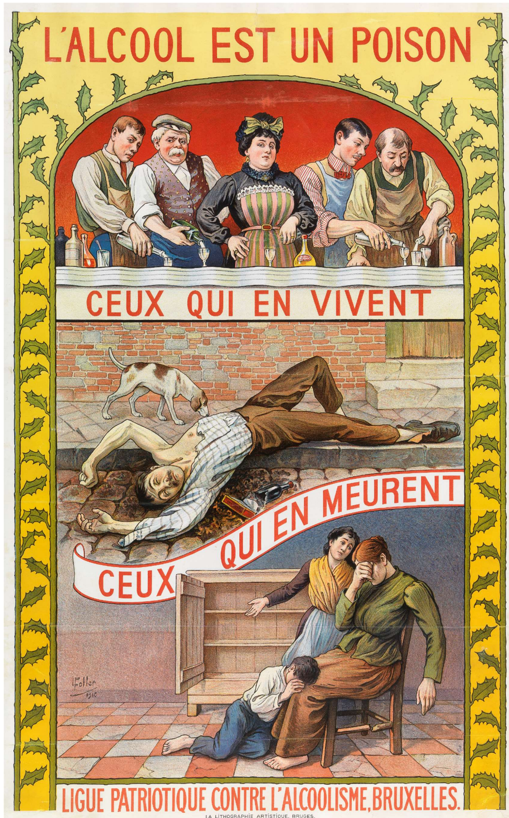
Afb. 2 | Lucien Foller, Affiche L'Alcool est un Poison, 1910, collectie Jenevermuseum, Hasselt.