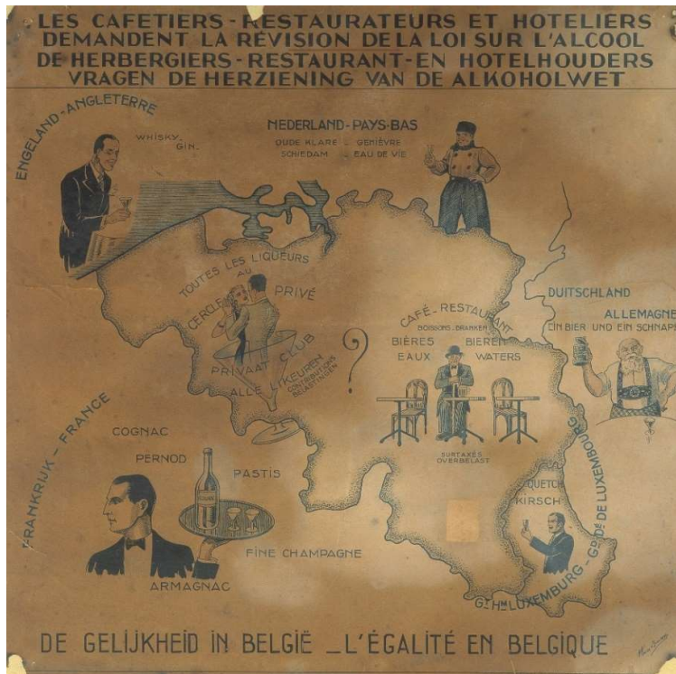
Afb. 6 | Herbergiers, restauranthouders en hoteliers vragen de herziening van de alcoholwet, ca. 1925. In het buitenland en in privéclubs mag sterkedrank geschonken worden, bij hen enkel water en bier.