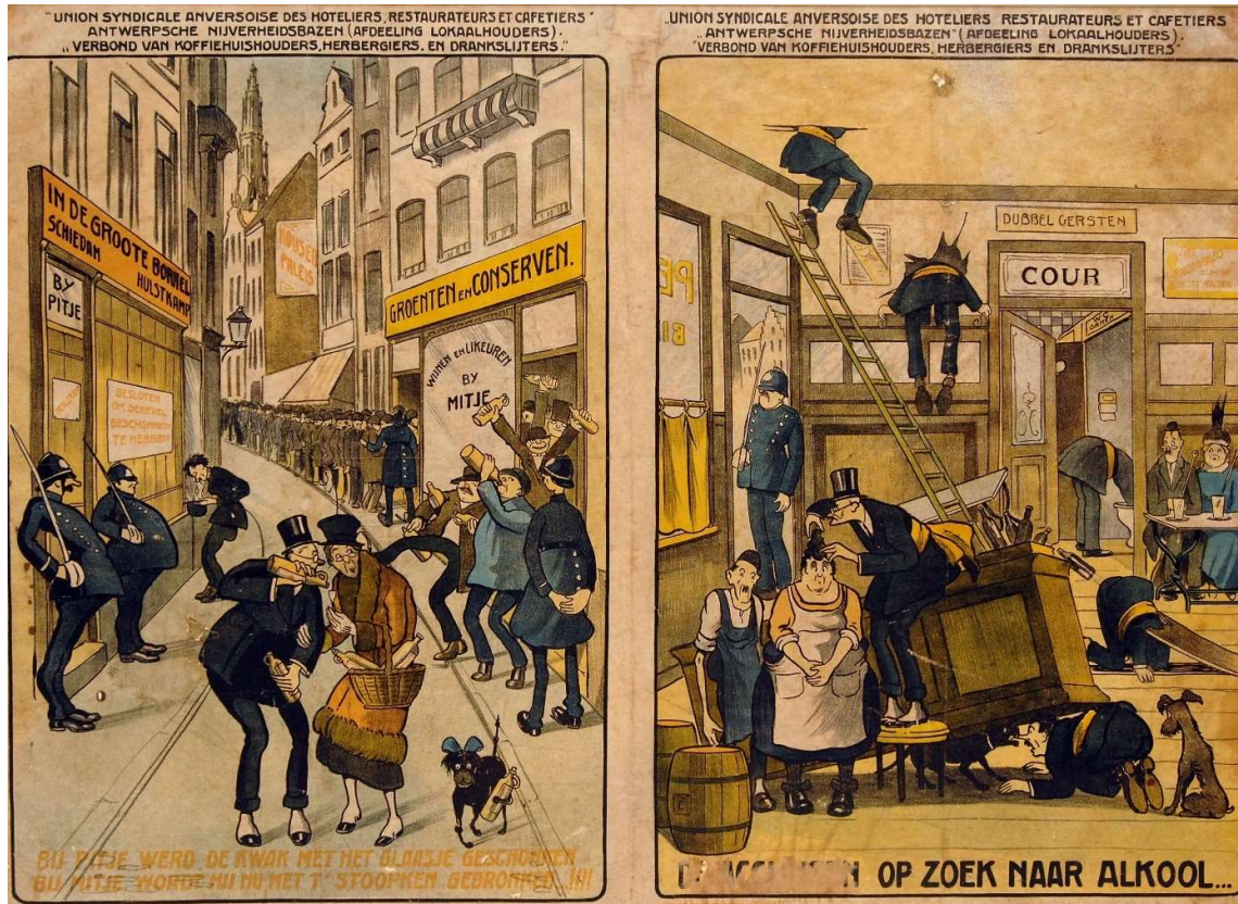
Afb. 5 | De accijnzen op zoek naar alcohol, 1919-1921