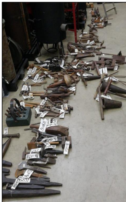
Een deel van de collectie tijdens de registratie in het museumdepot.