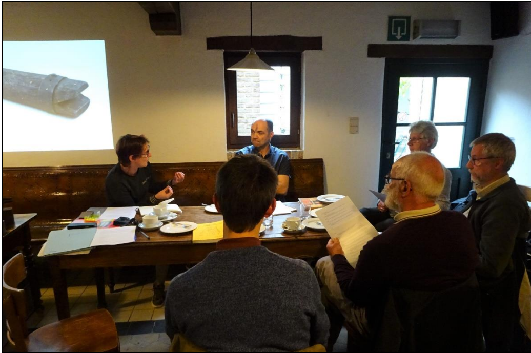
De waarderingssessie met de kuipers op 20 mei 2019.

worden als respectievelijk een bomtrekker met sponsleutels als handvatten en een hoepeldrijver.