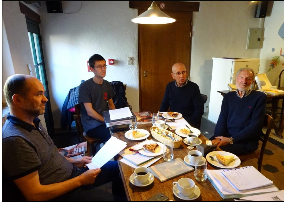
De waarderingsessie met de koperslagers op 15 mei 2019.